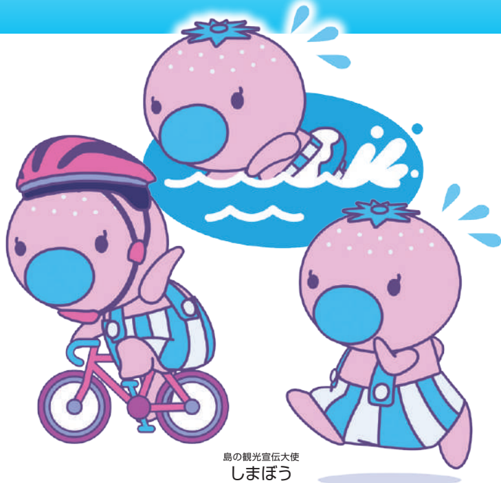
島の観光宣伝大使 しまぼう