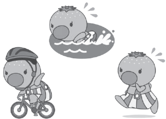
島の観光宣伝大使 しまぼう