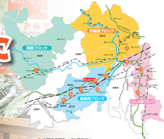
《JA岡山西の直売所マップ》