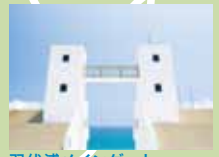
羽伏浦メインゲート